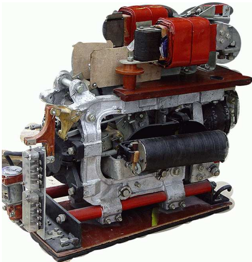
Рисунок 1 – Общий вид быстродействующего выключателя

Быстродействующий выключатель БВП-5 состоит из следующих основных узлов: корпуса, контактного устройства, включающего механизма, электромагнитного удерживающего устройства, дугогасительной системы и механизма блокировок. Общий вид выключателя (без дугогасительной камеры) показан на рисунке 1.